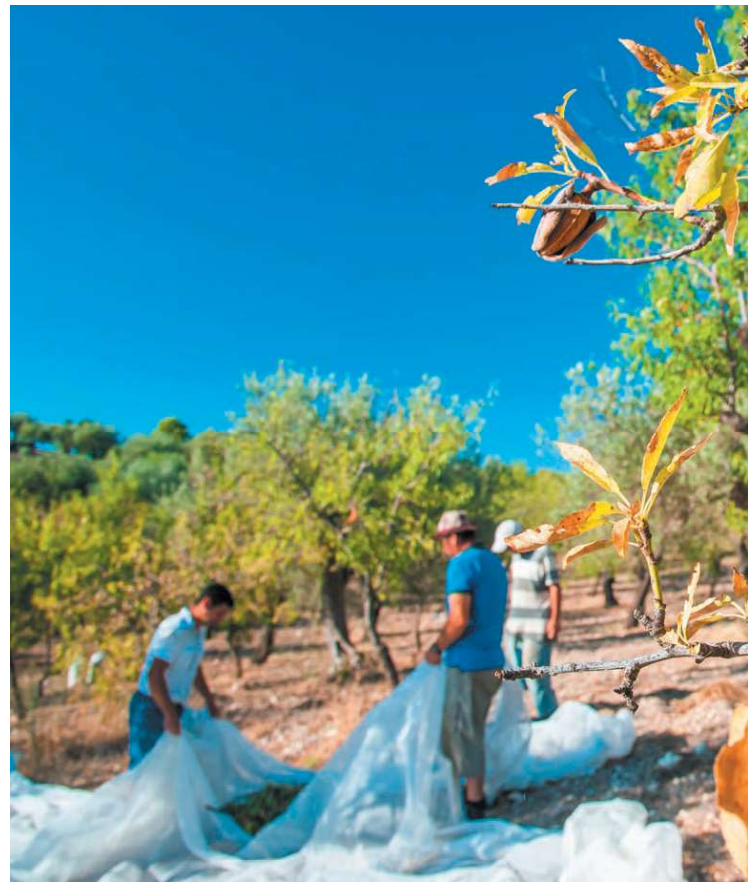
Παραγωγή και κατανάλωση καρπών ακρόδρυων στην Ελλάδα (2020, σε τόνους)

Μετά την πτώση του 2019, η παραγωγή νωπών κάστανων ανέκαμψε το 2020 (+19%) και το εμπορικό ισοζύγιο του προϊόντος πα-