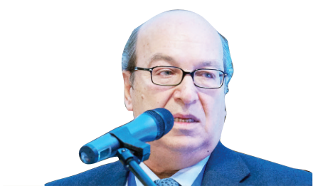
Άρθρο του κ. Γιάννη Τσιφόρου, επιστημονικού συνεργάτη της Gaia-Επιχειρείν

Σύμφωνα με τις τελευταίες διαθέσιμες εκτιμήσεις (στοιχεία Eurostat, 21/2/2024), οι παραδόσεις αιγοπρόβειου γάλακτος στην ΕΕ ανήλθαν το 2022 σε περίπου 4 εκατ. τόνους, παρουσιάζοντας άνοδο ως προς το 2021 (+2%), αλλά και σε σχέση με το μέσο όρο της προηγούμενης πενταετίας (+4,6%). Ειδικότερα, στο πρόβειο γάλα, οι παραδόσεις ανήλθαν το 2022 σε 2.217 τόνους, μέγεθος αισθητά αυξημένο σε σύγκριση με το 2021 (+4,4%), κυρίως εξαιτίας της σημαντικής αύξησης του στην Ισπανία (+19%). Μικρότερη ήταν η άνοδος των παραδόσεων του προϊόντος στην Ελλάδα, που ανήλθαν το 2022 σε 715 χιλ. τόνους (+1%), αλλά το μερίδιό της τη διατηρεί στην 1 η